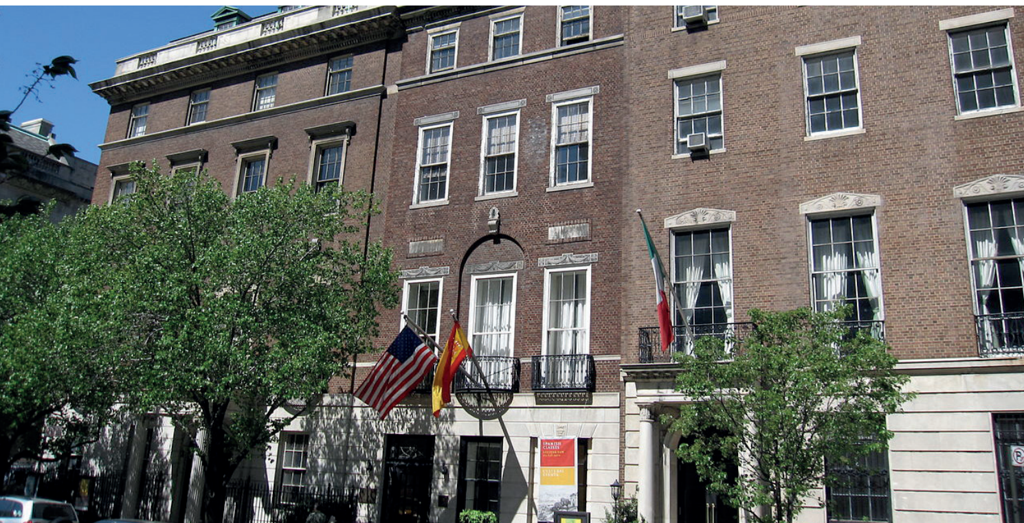
Sede del Queen Sofia Spanish Institute en Park Avenue, sede del QSSI desde 1967 hasta 2014 / Foto: Gryffindor (Creative Commons Licence)

Una nueva etapa comenzó tras la venta del edificio de Park Avenue en 2014.